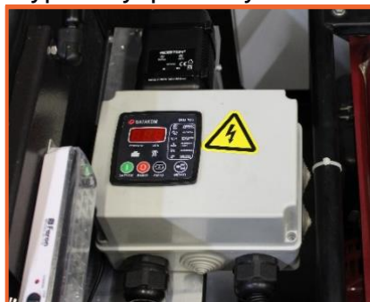
автозапуск (контроллер DATAKOM DKG 105)