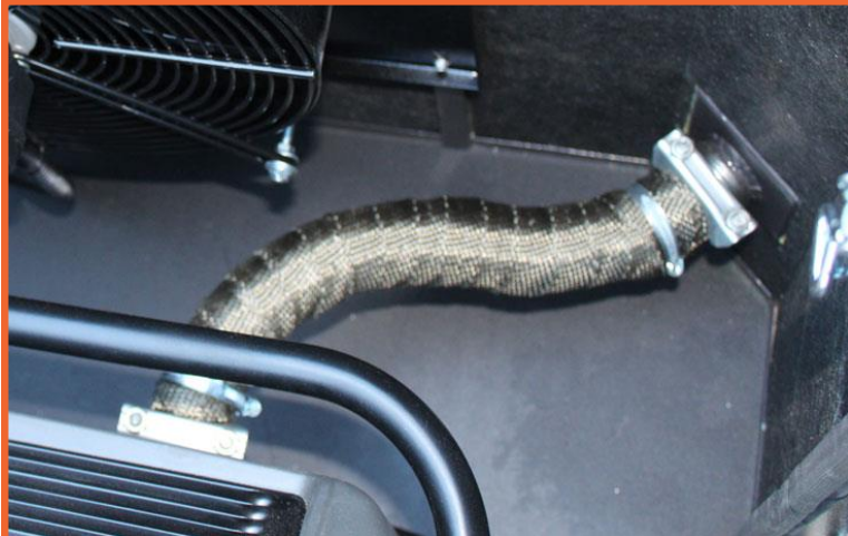
пример монтажа выхлопного тракта