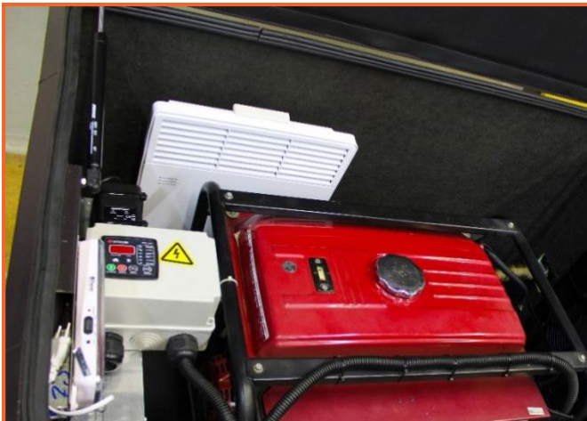
подогреватель на стенке кожуха