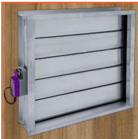
вентиляционный клапан с приводом

При использовании электроподогревателя для быстрого старта генератора в зимнее время важно сохранить тепло внутри конструкции кожуха. Для этого со стороны приточной вентиляционной решетки устанавливаются алюминиевые воздушные жалюзи с электроприводом. Применяется автоматический привод открывания Belimo BLF 230 (Siemens) с пружинным возвратом. При старте генератора привод поворачивает заслонки, открывая доступ уличному воздуху внутрь кожуха. При остановке генератора заслонки автоматически закрываются возвратной пружиной, сохраняя тепло.