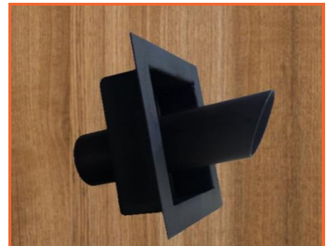
проходной элемент выхлопного тракта