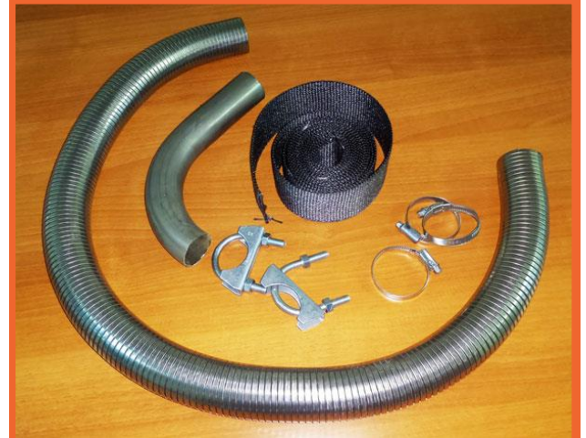
комплект выхлопного тракта