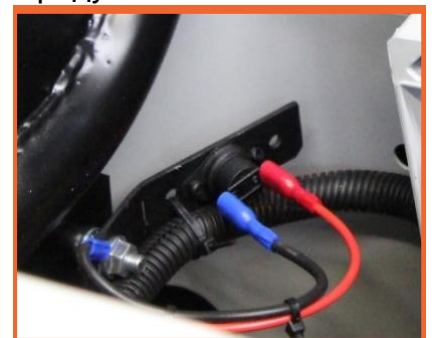
датчик перегрева воздуха