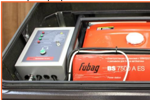
автозапуск (блок STARTMASTER для генератора FUBAG)

Специализированный контроллер для генераторных установок, измеряющий напряжение внешней сети. Автоматически запускает генератор при сбоях в электроснабжении и переключает потребителей на питание от автономного генератора. Возможен дистанционный контроль/управление по сотовой связи. Так же в этой опции устанавливается защитный датчик перегрева, автоматически останавливающий генератор при повышении температуры внутри кожуха свыше 80 градусов.