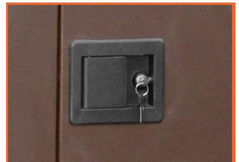
замок с ключом